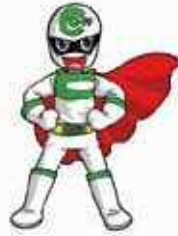
クーリング・オフマン