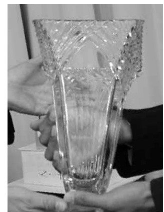
クリスタル製優勝カップ