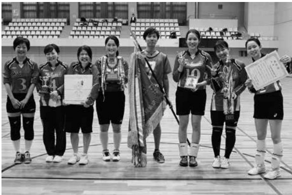
優勝 洛和会音羽病院チーム