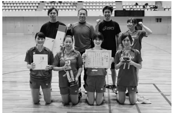
準優勝 京都・綾部ルネス病院チーム