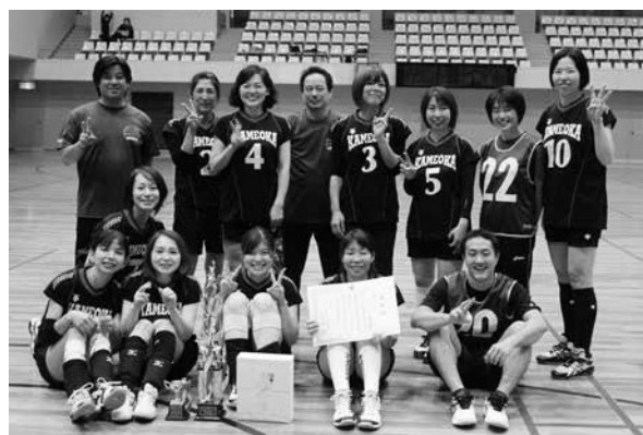
第3位 亀岡病院チーム