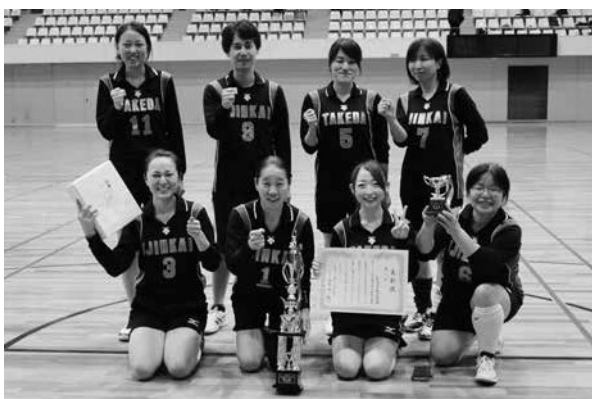
第3位 医仁会武田総合病院チーム