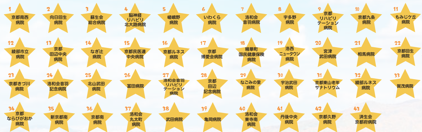
いきいき働く認定医療機関 (基本認定:令和3年10月末現在)

センターでは、現在、下記の43病院を「いきいき働く基本認定医療機関」に認定しています。基本認定に必要な50項目が達成できましたら、センターへ申請いただき、センターによる実施確認、認定審査会での審議を経て認定します。まずは取組みの初めとして宣言書をセンターにご提出いただき、その後、基本50項目が達成できましたら、センターへ申請をお願いいたします。