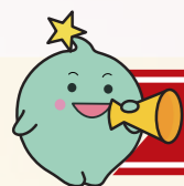
いきいき働く認定医療機関（基本認定：令和3年11月末現在）