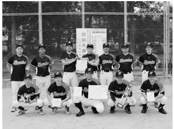
準優勝・伏見桃山総合病院チーム