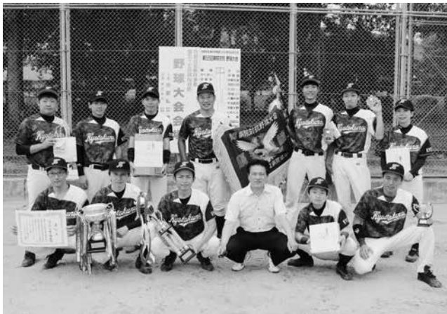
優勝・京都久野病院チーム