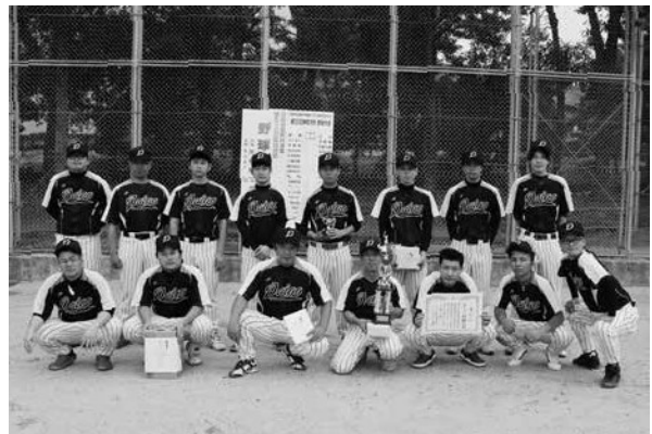
第3位・醍醐病院チーム