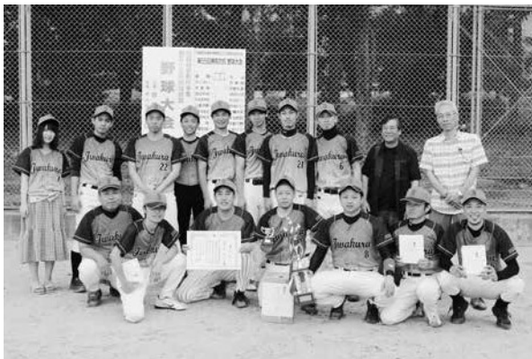
第3位・いわくら病院チーム