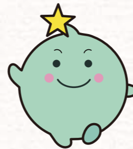
イメージキャラクター いきいきポップちゃん

当センターでは、雇用の質向上に取組むことを宣言・公表して勤務環境改善に取り組む府内病院を、京都府医療勤務環境改善支援センターが認定を行い、病院職員のモチベーション向上や人材確保・定着に資することを目的として、本年1月に「京都市いきいき働く医療機関認定制度」を開始しました。