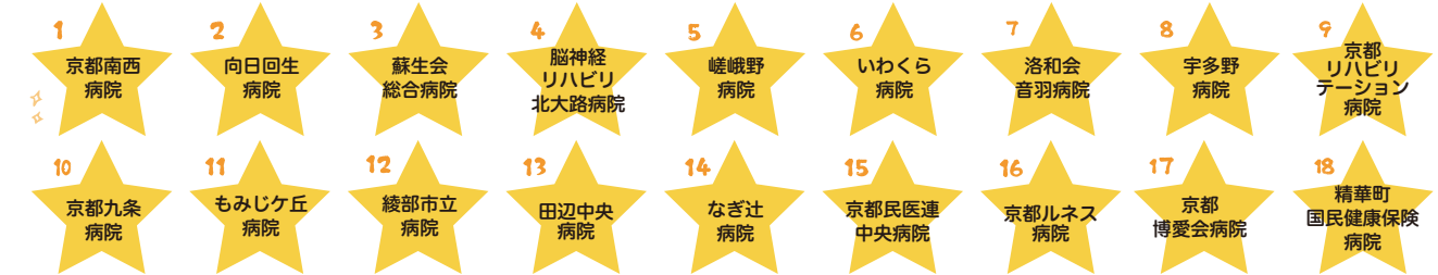
いきいき働く基本認定医療機関 (基本認定:平成30年9月末現在)